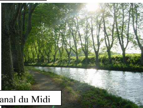
Canal du Midi